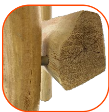
Naturalne drewno robinii.